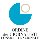
ORDINE dei GIORNALISTI CONSIGLIO NAZIONALE