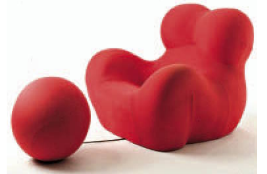
Poltrona Serie Up 2000 di Gaetano Pesce in mostra a Milano

La vespa Piaggio, la bici Graziella, la macchina da scrivere Olivetti, i baci Perugina. La storia del Design italiano rivive nell'undicesimo “Triennale Design Museum” di Milano. Un viaggio lungo un secolo, il ventesimo, tra icone che hanno segnato un'epoca. Fino al 20 gennaio 2019. triennale.org