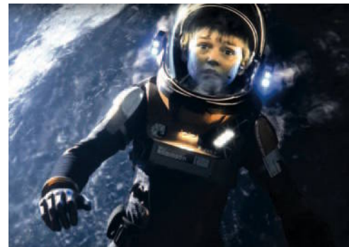
Un'immagine di Lost in Space

Rivoluzioni politiche e culturali, economiche e antropologiche. Sempre destinate a fallire o unico mezzo per cambiare l'ordine delle cose? A oltre cent'anni dalla Rivoluzione d'ottobre, se ne parlerà a “La storia in piazza”, evento ideato da Franco Cardini e Luciano Canfora: quattro giorni di incontri, reading e cortometraggi. Tra i protagonisti Moni Ovadia e Tomaso Montanari, Gustavo Zagrebelsky e Alessandro Barbero. lastoriainpiazza.it